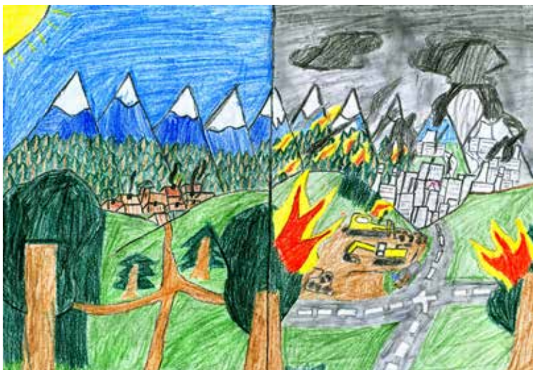
Paľko Kovaliček, 7.A