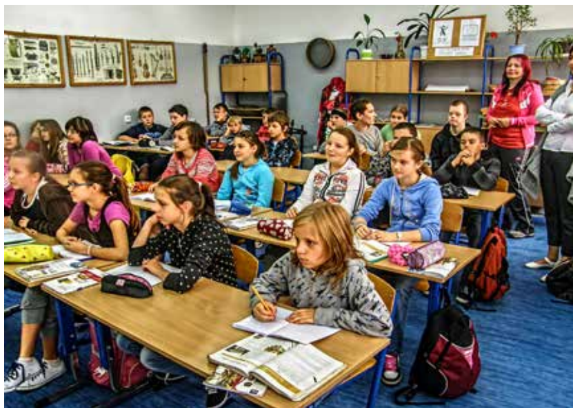
Z vyučovania v Poľsku sme mali zážitok aj my

„Áno, lebo si tam nájdú nových priateľov a zažijú množstvo nezabudnuteľných zážitkov.“