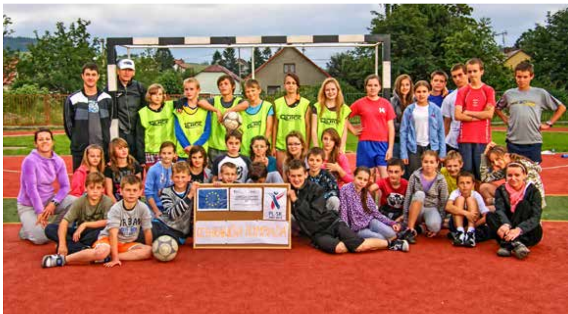
Športové hry s našimi poľskými kamarátmi