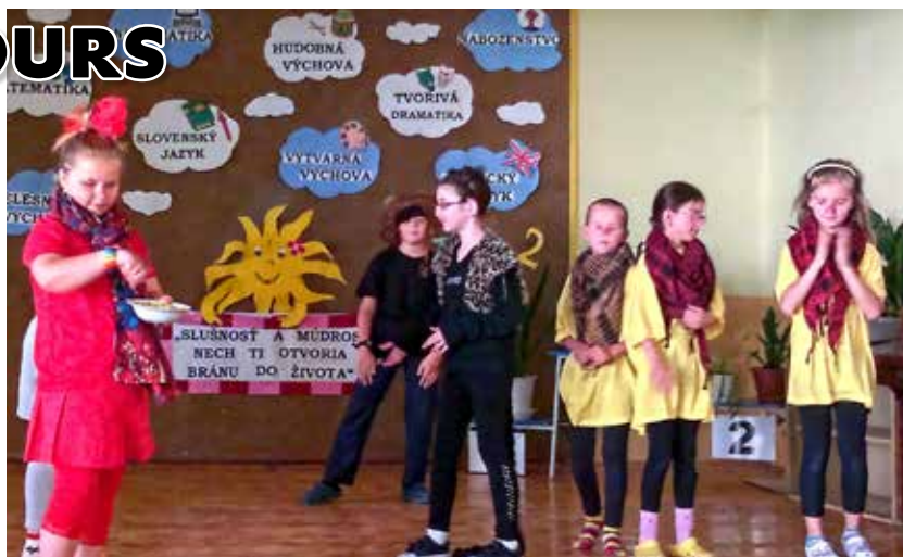
Divadelná inscenácia The Little Red Hen (Malá červená sliepočka) žiakov z 3. B triedy