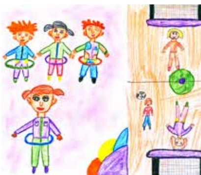
Katka Kutlákova, 6. B