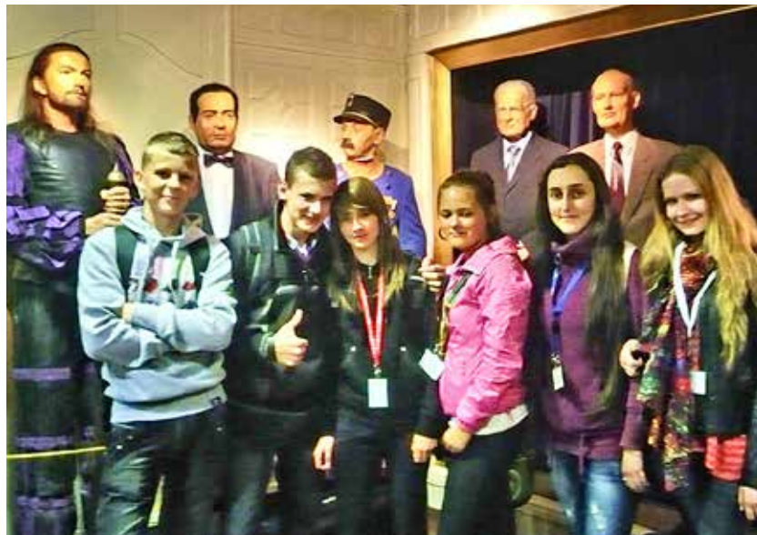
V Múzeu voskových figurín

V Prahe je krásne všetko. Videli sme kus veľkolepého mesta. Plavili sme sa loďou po Vltave a oči nám jasali krásnou panorámou okolia Prahy. Navštívili sme aj najväčšiu zoológickú záhradu v Prahe. Takúto ZOO veru u nás na Slovensku nikde nenájdete. Potom sme sa vybrali aj do botanickej záhrady. Veľmi nás to tam nebavilo. Celou prechádzkou záhrady sme počúvali hokej, zápas medzi Slovenskom a Kanadou. Po výhre nad Kanadou sa nám na kvety, stromy a rastliny pozeralo hneď s oveľa väčšou radosťou. Ďalej sme navštívili Vyšehrad, Mostecké veže, Vald-