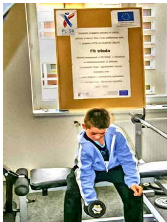
Cvičenie vo FIT triede máme radi