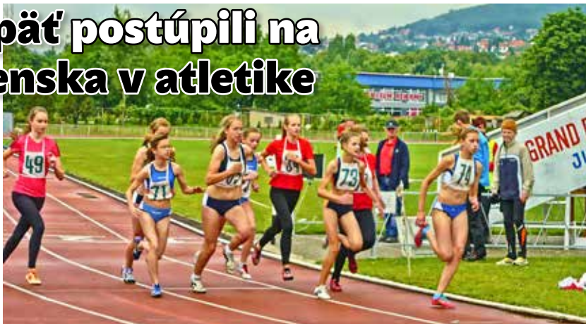
Na Majstrovstvách Slovenska v atletike