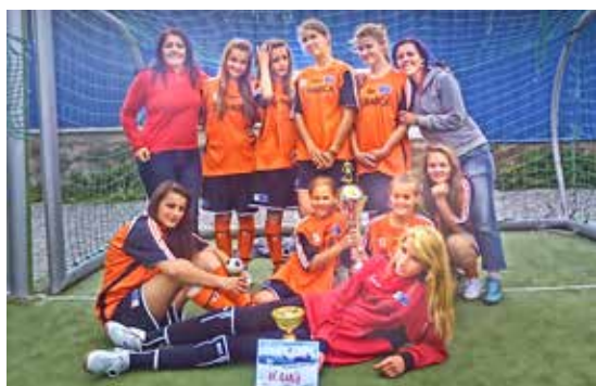
Vítazstvo našich dievčat vo futbalovej Dilong Lige