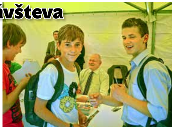
Na autogramiáde s prezidentom

li ich svojimi úsmevmi. Motiváciu k športu našim žiakom vniesla autogramiáda známych úspešných slovenských športovcov. V Prezidentskej záhrade, ktorá bola taktiež sprístupnená verejnosti, bol pripravený program, kde boli tvorivé dielne a vystúpenia hudobných a tanečných skupín. Pre našich žiakov, ktorí úspešne reprezentujú školu v športových súťažiach, to