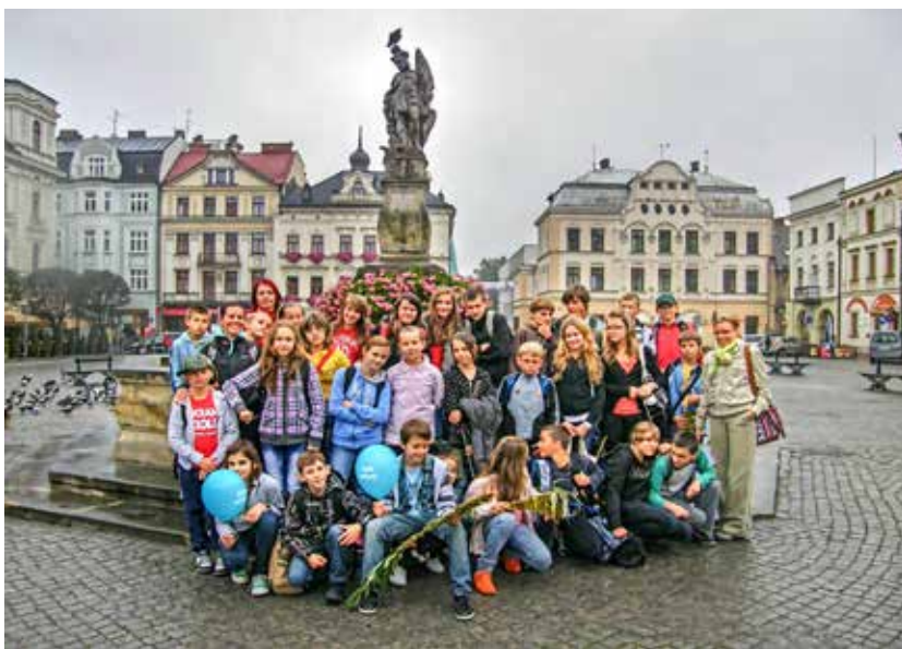
Spoznávame domov a kultúru našich kamarátov z Poľska

Počas projektu sme spolu s poľskými žiakmi vytvorili dve brožúry: Predstavím Ti miesto, kde žijem – informačný leták, ktorý zachytáva región Oravu. Druhá brožúrka bola Nauč sa moju reč – vytvorili sme 100 najbežnejších fráz a slov, ktoré uľahčia dorozumievanie sa v prihraničnom slovensko-poľskom priestore.