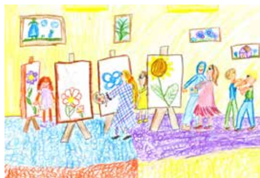
Viktória Kubalová, 6. B