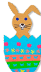
Matej Palider, 1. C