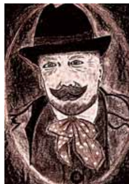
Reprodukcia P. O. Hviezdoslav Katka Iskierková, 9. A