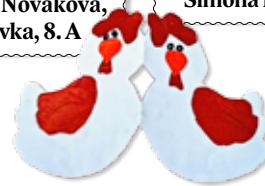
Ninka Juritáková, 1. B