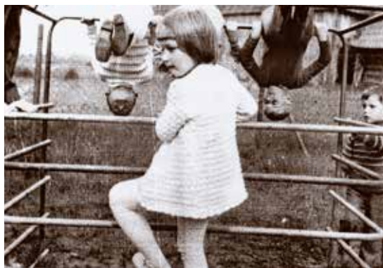
Hry detí v škole 1973/74