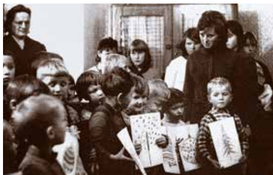
MŠ v Rabči 3. 2. 1965 zahájenie prevádzky