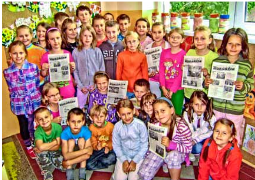
Naši aktívni reportéri z hornej základnej školy (HZŠ)

Prajeme všetkým našim čitateľom a deťom príjemné prežitie prázdnin a letných dovoleniek. V septembri sa pani učiteľky z HZŠ s MŠ I. opäť tešia na svojich skvelých žiakov.